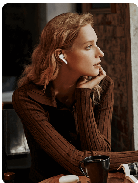
Odpravljanje hrupa v uravnoveženem načinu Kavarne, parki

Izpolnite svoje posebne zahteve glede odpravljanja hrupa