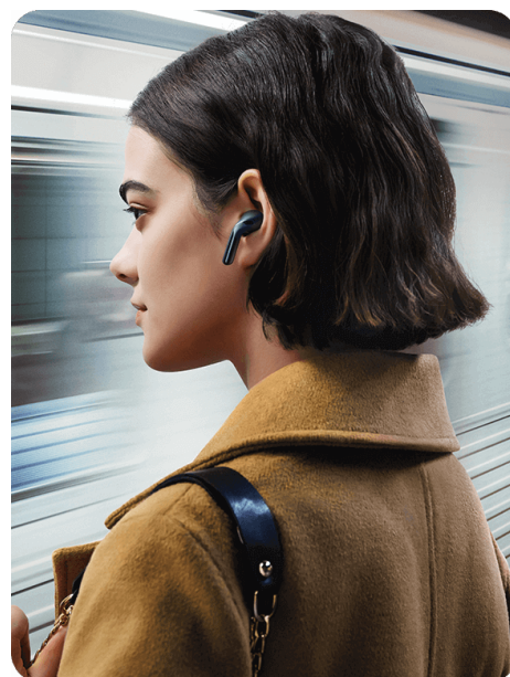
Odpravljanje hrupa v polnem načinu Podzemni vlaki, letališča