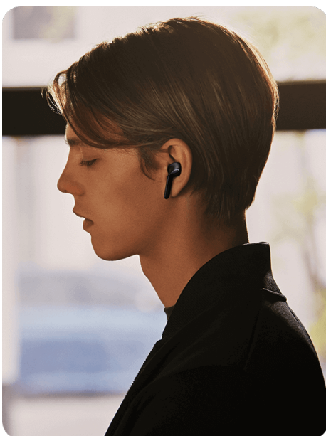
Odpravljanje hrupa v pogovornem načinu Pisarne, knjižnice